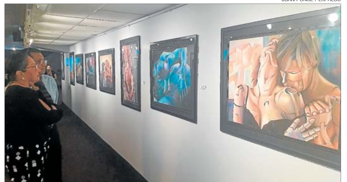
Asistencia. A la inauguración de la exposición asistieron pintores, familiares y exalumnos de la artista.

Con esta exposición, la artista cierra su producción artística. La primera se trató de una serie de cacao; la segunda, del árbol y la tercera sobre el arte precolombino. "Esta etapa es